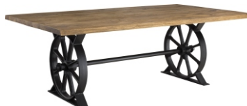
Ława Alvador 130x80x48