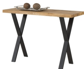
Konsola Imple 110x42x75