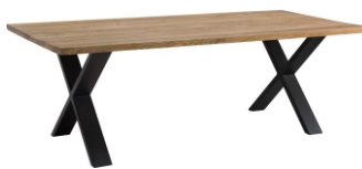
Ława Imple 110x65x42