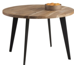
stół okrągły Oho fi 100 do 150x74

Stół nierozkładany/ rozkładany Oho 140x85/+2x45x74 160x90/+2x45x74 180x100/+2x60x74 200x100/+2x60x74 220x100/+2x60x74