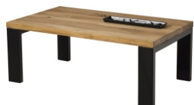
Ława Dine/ Esto 110x65x42