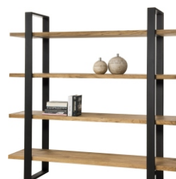
Regał Dine 180x45x81