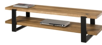
szafka RTV Dine 160x45x40