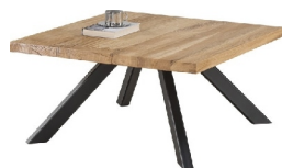
Ława Vante 110x65x42