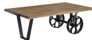
stół nierozkładany Alvador 210x120x74

stół nierozkładany Dine 160x100x75 180x100x75 200x100x75 220x100x75