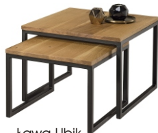
Ława Ubik 50x50x38 60x60x45