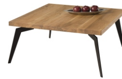
Ława Pider 90x90x42 110x65x42