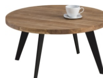
Ława okrągła Oho fi 70 do 100x42