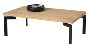
Ława Lues 120x70x39