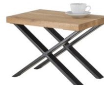
stolik nocny Imple 57x42x42