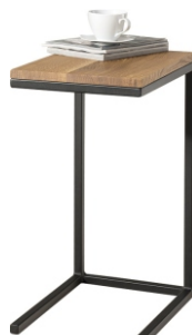
Pomocnik Ubik 50x35x71