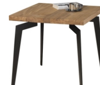
Stolik Pider 60x60x56