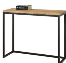
Konsola Ubik 90x35x78